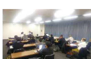
2023年度 第4回東京地区会議 2023年11月28日