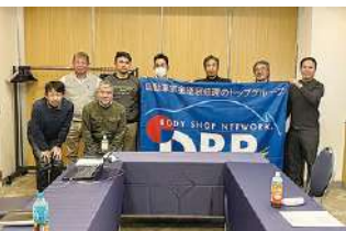
2023年度 第2回長野地区会議 2023年12月6日