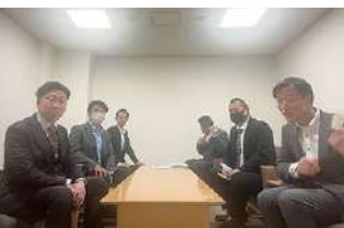
2024年度 第1回北陸ブロック地区部長会議 2024年3月7日