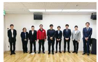
2024年度 第1回四国ブロック会議 2024年3月15日