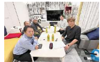
2023年度 第4回大分地区会議 2023年12月2日