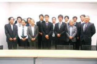
2023年度 第4回神奈川地区会議 2023年11月24日