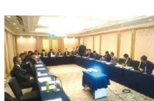
2023年度 第4回千葉地区会議 2023年12月2日