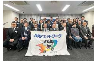
2023年度 関西ブロック勉強会 2023年11月18日