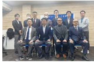
2023年度 第4回宮城地区定例会議 2023年11月17日