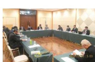
2024年度 第1回千葉地区会議 2024年3月23日