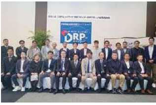
2023年度 四国東海ブロック合同勉強会 2023年11月4日