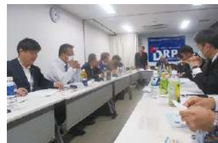
2024年度 第1回全国ブロック長会議 2024年1月20日