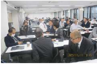
第10回 首都圏甲信越ブロック勉強会 2023年11月11日