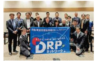
2023年度 第4回九州ブロック地区部長会議 2023年11月18日