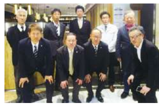
2024年度 第1回関西ブロック地区部長会議 2024年3月9日