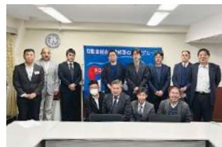
第1回 首都圏甲信越ブロック地区部長会議 2024年2月6日