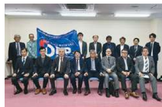
2024年度 第1回九州ブロック地区部長会議 2024年3月9日