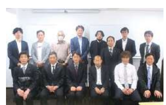
2024年度 第1回神奈川県会議 2024年2月20日